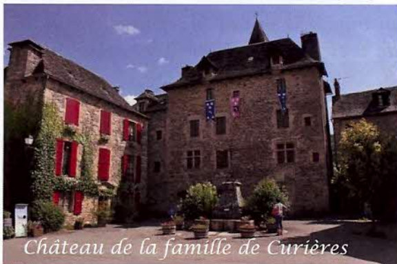
Château de la famille de Curières

été restaurées, sans que ces travaux de remise en état viennent altérer une harmonie architecturale qui atteste l'extrême ancienneté des premières occupations du site. L'église est vraisemblablement un des plus anciens édifices du bourg. Vue de l'extérieur, cette église paroissiale, bien que remaniée au cours des XIIe et XIVe siècles, garde la robustesse massive des premiers sanctuaires romans. Elle occupe le centre du village avec la puissance d'une