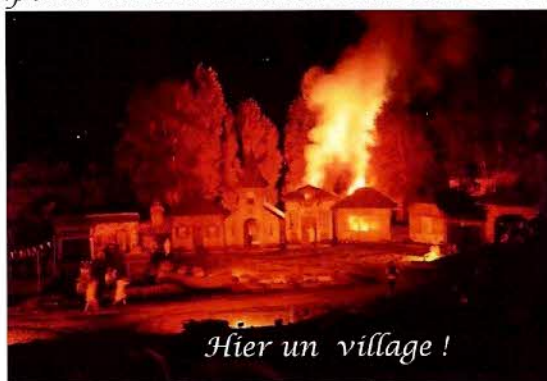
Hier un village !