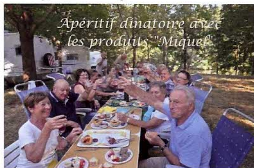
Apéritif dînatoire avec les produits "Miquel"

Lundi 25 juillet: Nous nous installons sur l'aire de Bouillac, où les 22 équipages viennent nous rejoindre. Dès 16 heures, notre partenaire "Charcuterie MIQUEL" qui se trouve à 300m, nous attend pour visiter ses ateliers de conserverie et nous offre tout un assortiment de ses produits que nous dégusterons lors de notre apéritif d'accueil. Tout le monde fait des emplettes dans sa boutique.