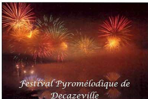
Festival Pyromélodique de Decazeville

Avant de commencer cette sortie, nous avons la possibilité de nous inscrire pour assister au Festival Pyromélodique de Decazeville du 23/07/2016. Une dizaine d'équipages de SMH se sont retrouvés sur le site. Ce festival aura mis en concurrence quatre pays ; l'Espagne, l'Italie, l'Angleterre, et la France. De ce concours, l'Italie aura été classée 1ère.