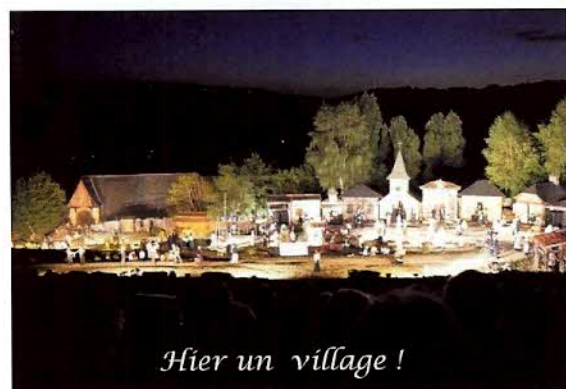
Hier un village !

Vers 16h, destination finale : Flagnac. Nous