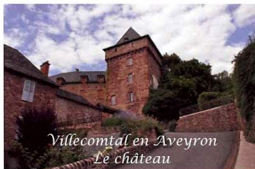
Villecomtal en Aveyron Le château

Fabuleux et merveilleux spectacle de feux d'artifice durant 2 heures avec l'effet miroir dans le lac.