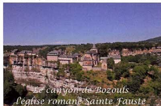
Le canyon de Bozouls l'église romane Sainte Fauste

curiosité naturelle, l'histoire de Bozouls et de son patrimoine. Deux arrêts nous laissent le temps d'admirer le site et de prendre des photos : un arrêt au niveau du Saut du Mendiant, point culminant de la falaise qui surplombe la cascade du Gourg d'Enfer, un arrêt à l'église romane Sainte Fauste édifée sur le promontoire rocheux, au cœur du site.