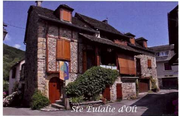
Ste Eulalie d'Olt

Certaines des maisons, les plus anciennes, alignées de part et d'autre de la rue principale traversant le bourg d'est en ouest, ou bordant les venelles menant vers la berge de la rivière, ont été bâties avec les pierres polies par les eaux durant des millénaires. Quelques-unes d'entre elles sont ornées de colombages vivement colorés, d'autres sont éclairées par des fenêtres dont les meneaux furent sculptés au temps de la Renaissance. La plupart ont