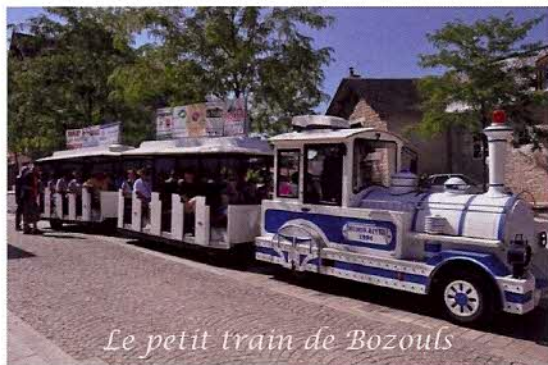
Le petit train de Bozouls

Deux groupes sont formés, l'un pour la visite du canyon en petit train ; Au cours d'une heure de balade, nous découvrons les secrets de la formation de cette curiosité