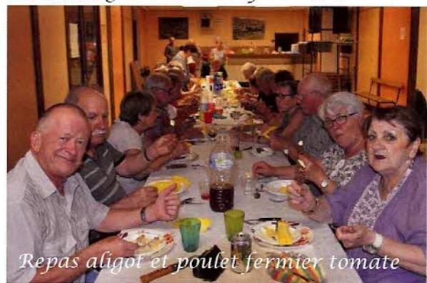
Repas aligot et poulet fermier tomate